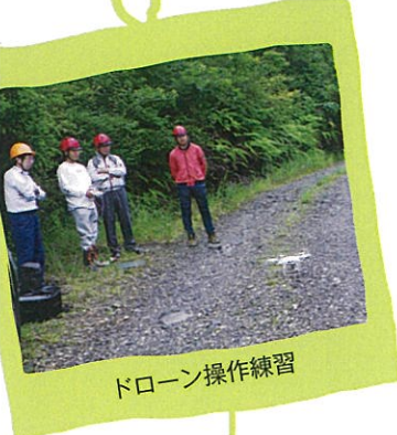
ドローン操作練習