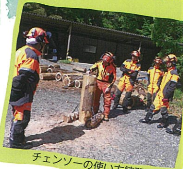
チェーンソーの使い方練習